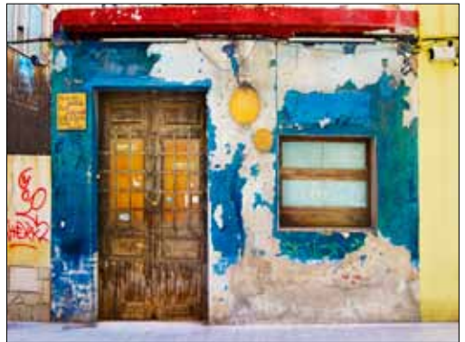
Alfred Lieury - 2on Premi