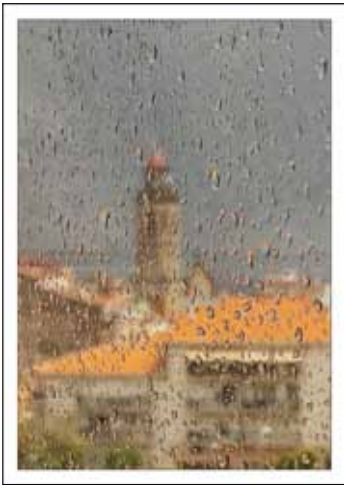
Eva Colomer - 3er Premi