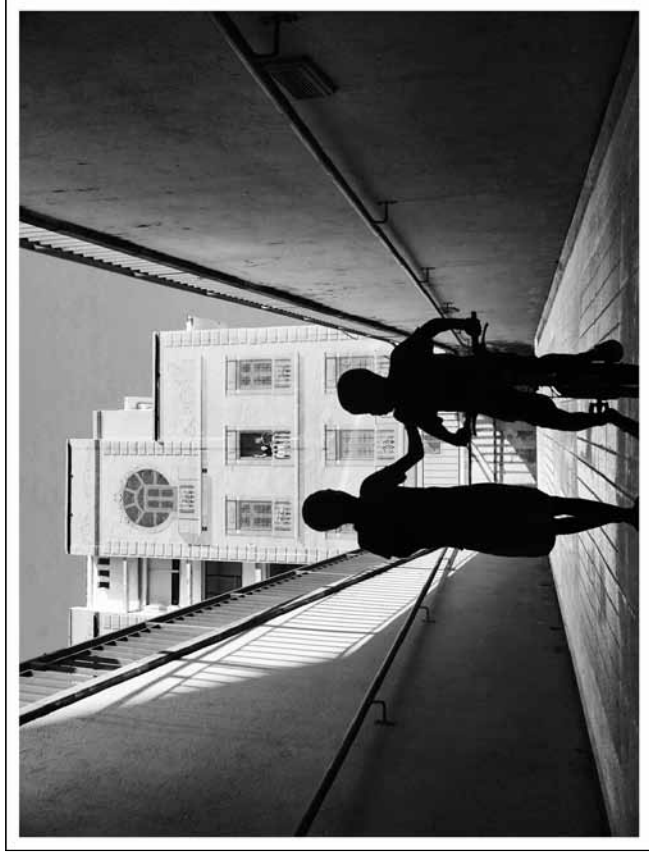
Premi d'Honor 26è Trofeu Carpinell de Fotografia, Tema Calella autor: Robert Lluis (original en color)