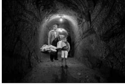
Tercer Premi Joan M. Arenaza (original en color)