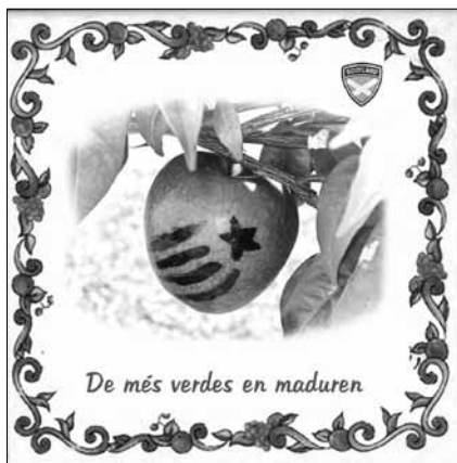
(original en color)