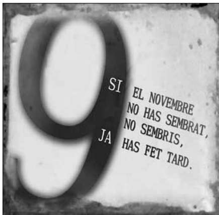
(original en color)