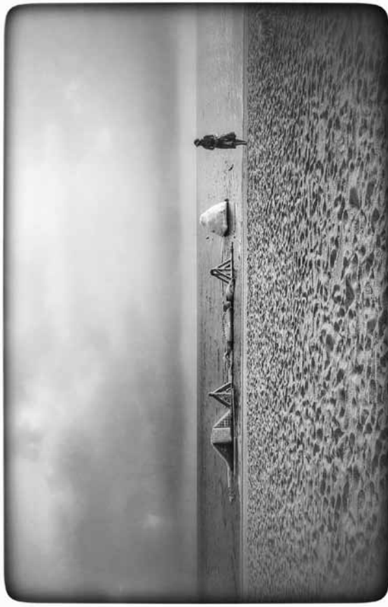
Foto guanyadora del 23è Trofeu Rafael Carpinell 2014 (original virat)