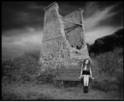
Segon Premi Raul Villalba (original en color)